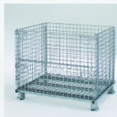
金属架台 ボックスパレット