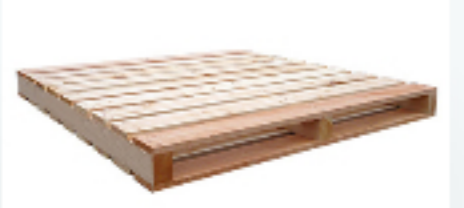
パレット 木製パレット