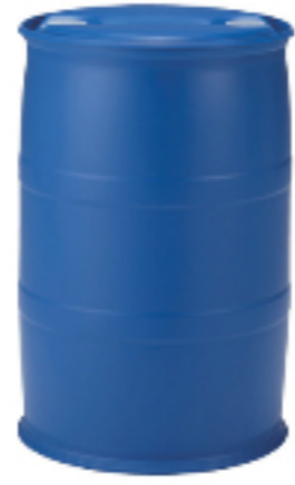
プラスチック容器 クローズポリドラム缶