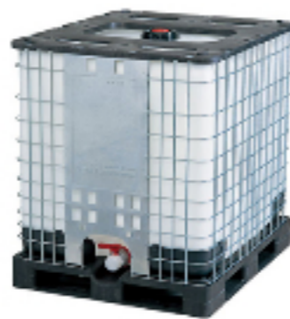
大型コンテナ IBCコンテナ