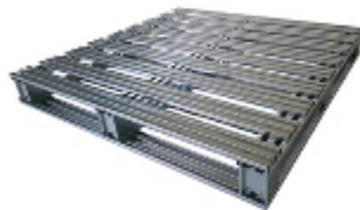
パレット スチールパレット