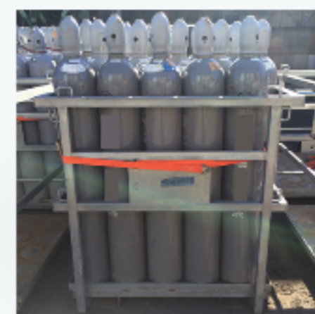
金属架台 48Lポンベ架台