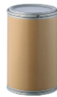
ファイバードラム 鉄蓋式ファイバードラム缶