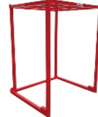
保管設備 ネステナー