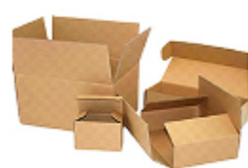
ダンボール ダンボールケース