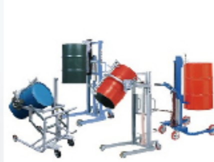
ドラム缶 ドラムポーター