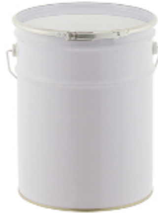
金属缶 ペール缶バンドタイプ