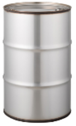
ドラム缶 クローズステンレスドラム缶