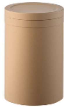
ファイバードラム オールファイバードラム缶