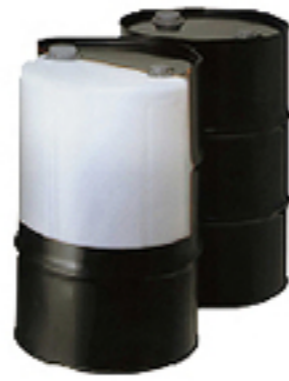
ドラム缶 ケミカルドラム缶