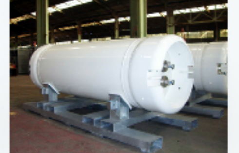
金属架台 大型ポンベ架台