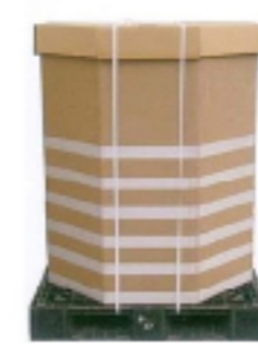
ダンボール 強化ダンボールコンテナ