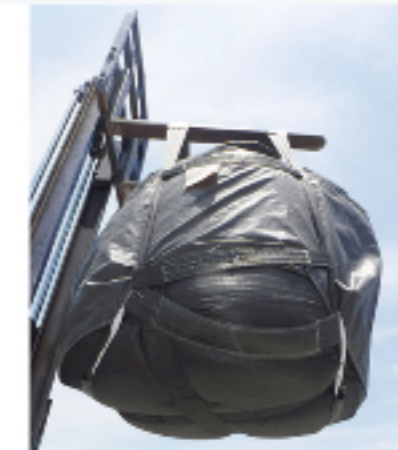
フレキシブルコンテナ コンテナバック用キャリアー