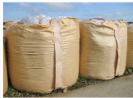
フレキシブルコンテナ ワンウェイフレコン