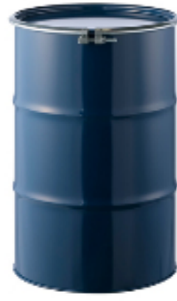
ドラム缶 オープンドラム缶