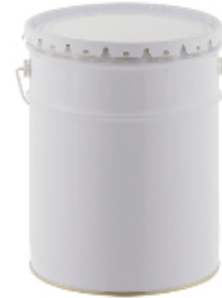
金属缶 ペール缶ラグタイプ