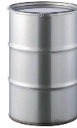
ドラム缶 オープンステンレスドラム缶