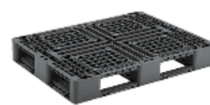
パレット 樹脂パレット