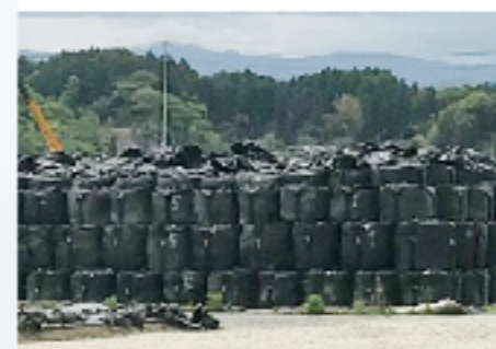
フレキシブルコンテナ 耐候性大型袋