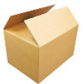
ダンボール 強化ダンボールケース