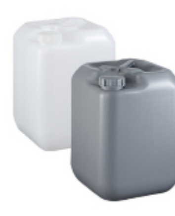
プラスチック容器 ポリ缶