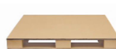
パレット ダンボールパレット