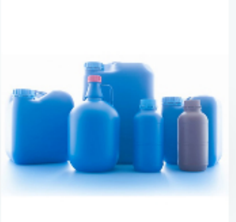
プラスチック容器 ピュアボトル