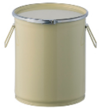
金属缶 オープンペール缶