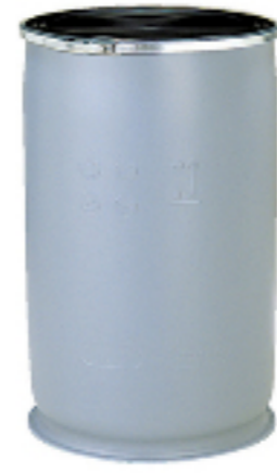
プラスチック容器 オープンポリドラム缶