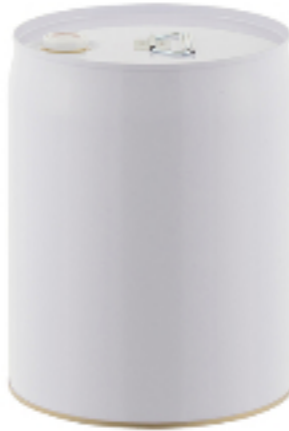
金属缶 クローズペール缶