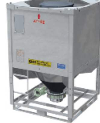
大型コンテナ 複合コンテナ